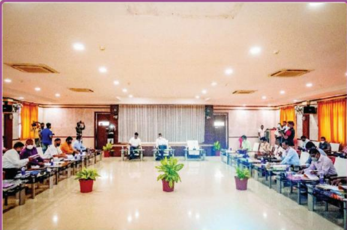
ତା. ୧୧.୧୦.୨୧ରେ ନୀଳାଦ୍ରି ଭକ୍ତ ନିବାସ ଠାରେ ଶ୍ରୀମନ୍ଦିର ମୁଖ୍ୟ ପ୍ରଶାସକ ଡଃ. କ୍ରିଷନ୍ କୁମାରଙ୍କ ଅଧକ୍ଷତାରେ ଆହୃତ 'ଅର୍ଥ-ସବ୍ କମିଟି' ବୈଠକ ।