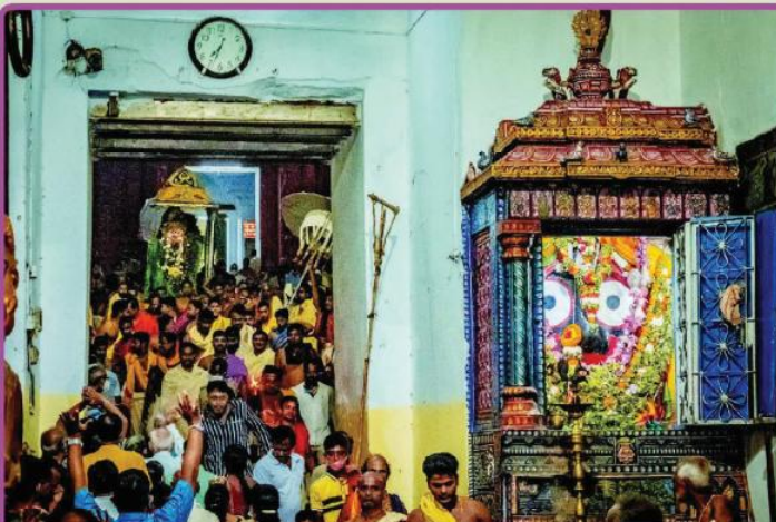
ତା. ୨୦.୧୦.୨୧ରେ କୁମାର ପୂର୍ଣ୍ଣିମା ଅବସରରେ ଶ୍ରୀସୁଦର୍ଶନ ଦେବଙ୍କ ଆଶ୍ରମ ବିଜେ ।