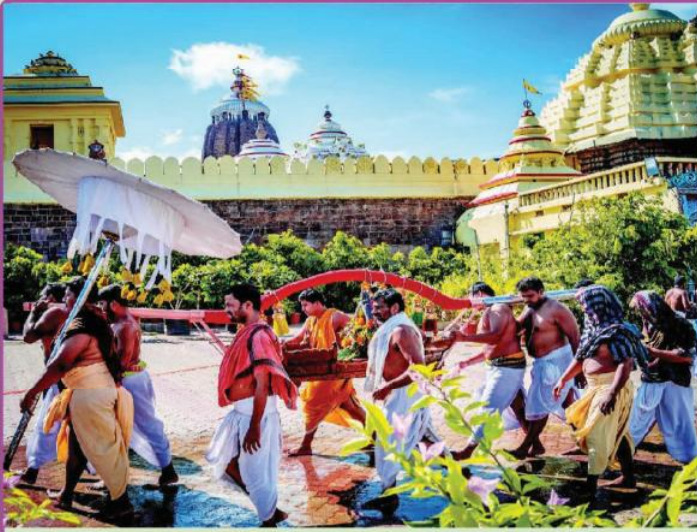
ତା. ୨.୧୦.୨୧ରେ ମହାଳୟା ଅମାବାସ୍ୟା ତିଥିରେ ଶ୍ରୀନାରାୟଣଙ୍କ ସାଗର ବିଜେ ।