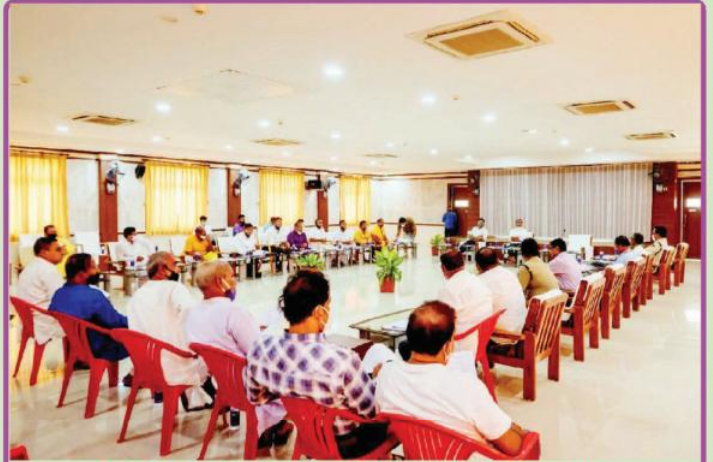
ତା. ୧୧.୧୦.୨୧ରେ ନୀଳାଦ୍ରି ଭକ୍ତ ନିବାସ ଠାରେ ଶ୍ରୀମନ୍ଦିର ମୁଖ୍ୟ ପ୍ରଶାସକ ଡଃ. କ୍ରିଷନ୍ କୁମାରଙ୍କ ଅଧକ୍ଷତାରେ ଆହୃତ 'ଛତିଶା ନିଯୋଗ' ବୈଠକ ।